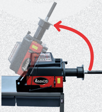
Gruppo di misura ribaltabile ad ingombro zero

ESTREMAMENTE COMPATTA. IDEALE PER ESSERE INSTALLATA SU FURGONI PER IL SERVIZIO MOBILE, BANCHI DA LAVORO O AMBIENTI POCO SPAZIOSI